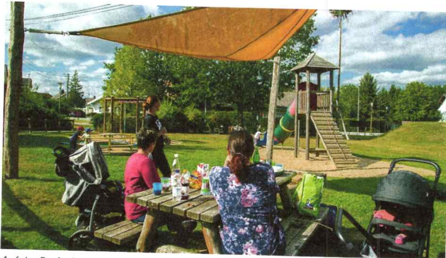
Auf der Dorfanlage Kornbitze ist immer was los.

Für 2026 steht außerdem ein großes Jubiläum an: Dann wird die ortseigene Wiedhöhenhalle, das Dorfgemeinschaftshaus von Kurtscheid, 50 Jahre alt.