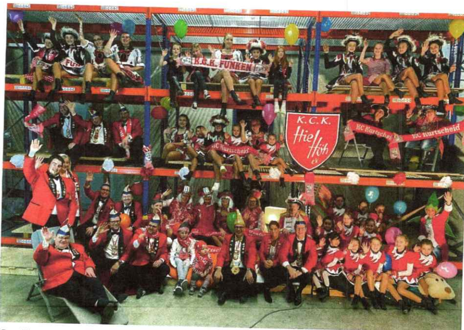
Der Karnevalsverein Hie Höh 1967 e.V. ist Institution und Stimmungsgarant.